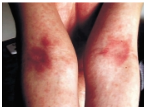
Dermatitída spôsobená baktériou Opisthorhis Felineus