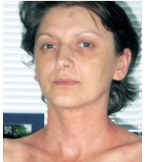
Stav po Skenar terapii